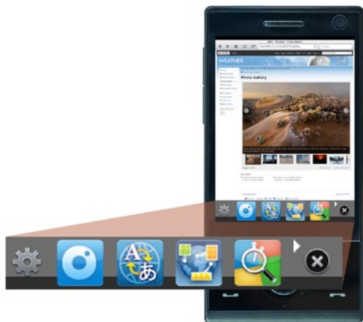
図1: Amplitudeのフローティングツールバーがパーソナライズ可能なコンテンツとサービスを提供

購入全体の95%をごく一部のアプリケーションが独占している従来型のアプリケーションストアと異なり、Amplitudeのパーソナライズ機能と推奨機能では、ロングテールコンテンツをそれを求めているニッチユーザーと結びつけて、未開拓市場における収益生成機会を広げることができます。